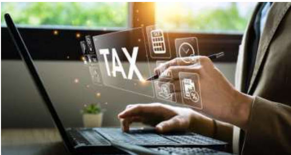
DIGITAL DRIVE. While reporting and reconciling GST turnover with ITR filings have been part of ITR forms, technology has changed the data capturing and data analytics.