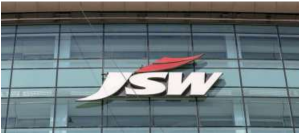
PLAN CRUSHED. The Supreme Court in its ruling on May 2 rejected JSW Steel’s resolution plan for BPSL.